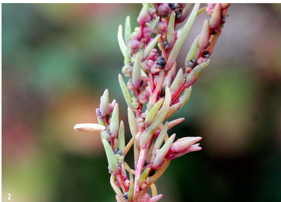
Fig. 2 : Soude maritime, marais de Notenno, 11-X-2022.