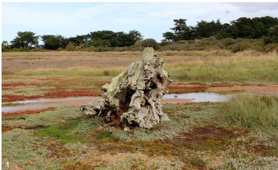
Fig. 1 : les marais de Notenno, Trébeurden (Côtes-d'Armor), 17-X-2022.

L'imago de couleur beige a une fine bande blanche incomplète le long de la côte de la base jusqu'au milieu de l'aile antérieure. Les antennes sont annelées sur toute la longueur. L'imago, visible en juillet et août est très difficile à déterminer sans l'examen des pièces génitales.